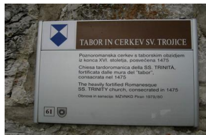
Slika 2: Označevanje nepremičnih kulturnih spomenikov

Zavod za varstvo kulturne dediščine Maribor, v katerega pristojnost spada naravna in kulturna dediščina na območju Občine Radlje ob Dravi, mora v svojem načrtu opredeliti objekte in ukrepe in naloge za zaščito in reševanje predmetov in objektov naravne in kulturne dediščine.