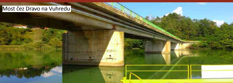
Most čez Dravo na Vuhredu