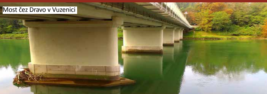
Most čez Dravo v Vuzenici