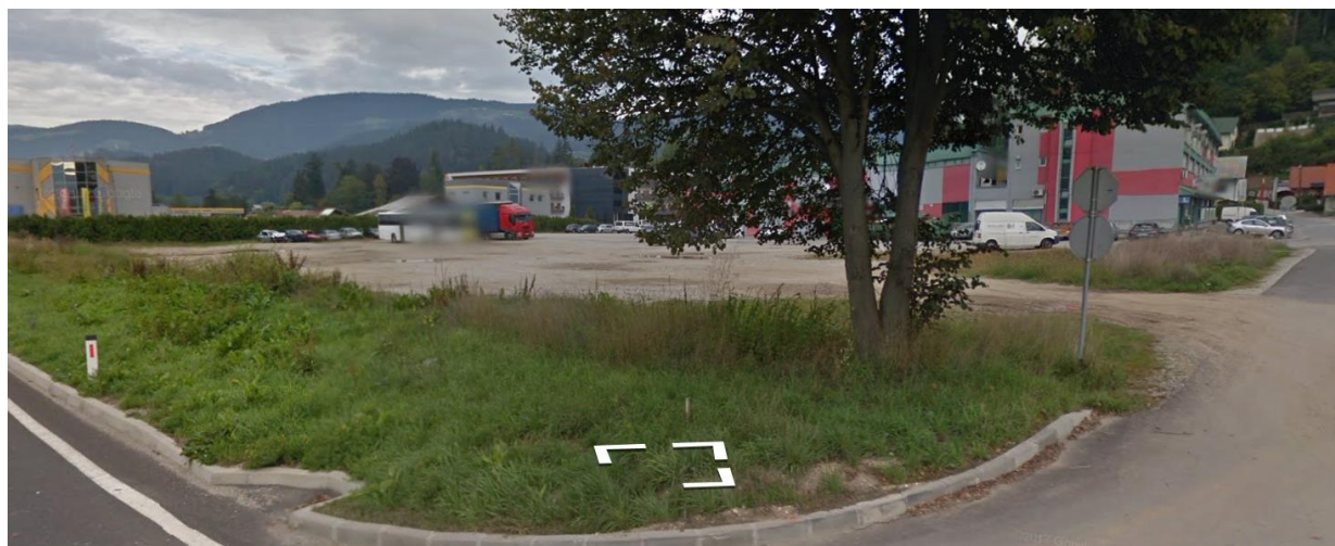
Slika 4: Pogled na območje proti SZ, Vir: https://www.google.si/maps/