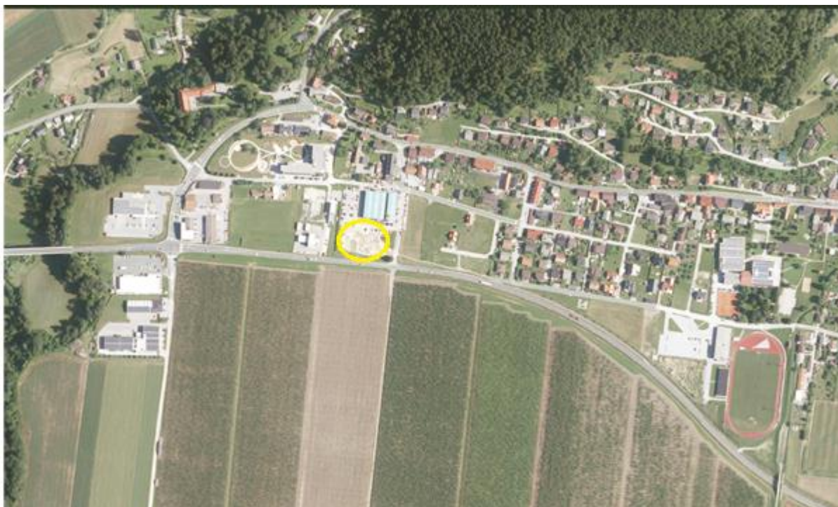
Slika 2: Širše območje, vir: ( http://gis.arso.gov.si/atlasokolja/profile.aspx?id=Atlas_Okolja_AXL@Arso )

Območje strokovnih podlag se nahaja severno od ceste Dravograd - Maribor, območje je na sliki označeno z rumeno barvo.