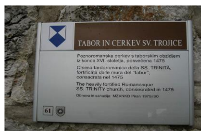
Slika 2: Označevanje nepremičnih kulturnih spomenikov

Zavod za varstvo kulturne dediščine Maribor, v katerega pristojnost spada naravna in kulturna dediščina na območju Občine Radlje ob Dravi, mora v svojem načrtu opredeliti