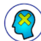
Začasna in dolgotrajna izguba zavesti