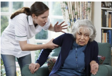
Pripravlil/-a: Jovita Pogorevc Merčnik

Bodimo družba z ničelno toleranco do nasilja nad starejšimi. Skupaj prepoznavajmo nasilje ter iščimo poti za dostojno in mirno življenje vsakega posameznika. Z medsebojno pomočjo to zmoremo.