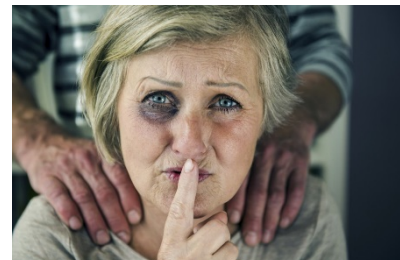
Podpisal/-a: Tadej Poberžnik direktor