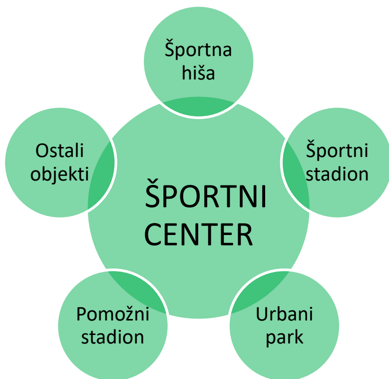
Shema 1: Elementi športnega centra